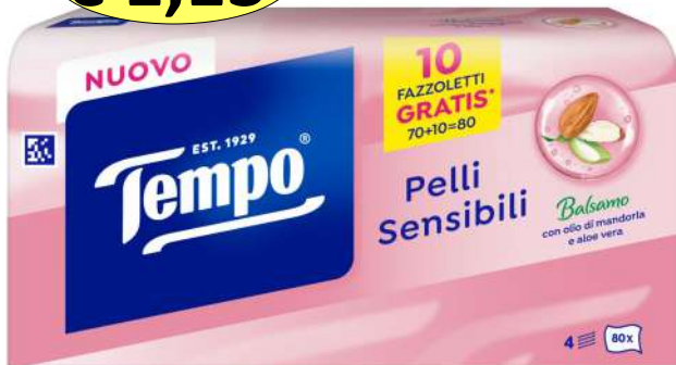
021354 FAZZOLETTI VELINE BOX X 80 4 VELI PELLI SENSIBILI