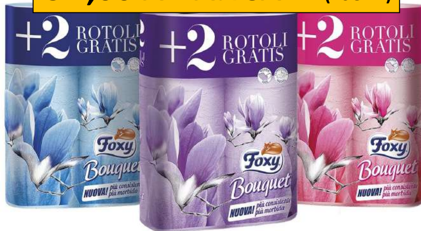
009140 FOXY BOUQUET CARTA IGIENICA 4+2 OMAGGIO COLORATA

CONFEZIONE 100% RICICLABILE PRODOTTA CON PLASTICA RICICLATA* (etichetta verde sul retro)