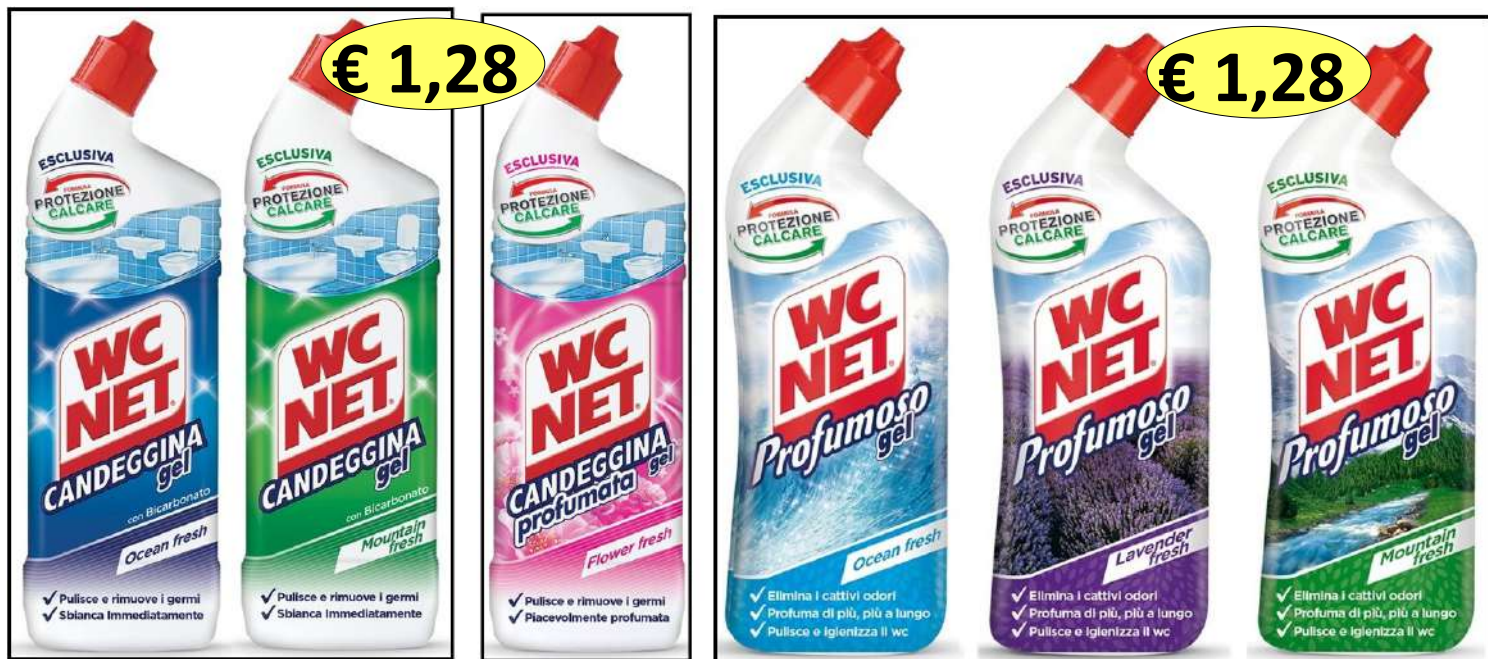
006320 OCEAN/MOUNTAIN - 006321 CANDEGGINA - 226310 PROFUMOSO MIX WC NET GEL ML.700