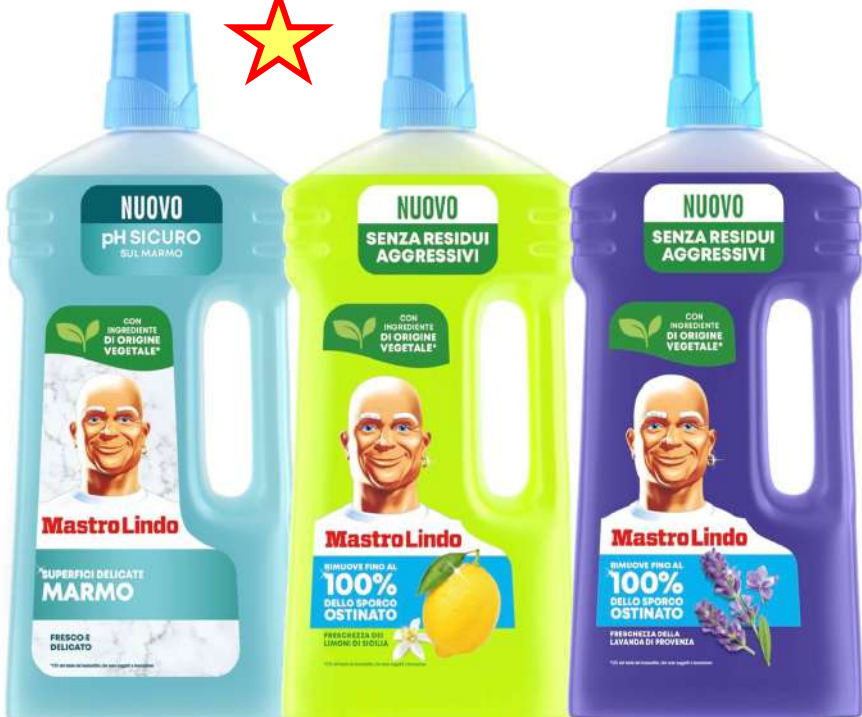
316252-316260-316267 MASTRO LINDO PAVIMENTI ML.930 MARMO-LIMONE-LAVANDA