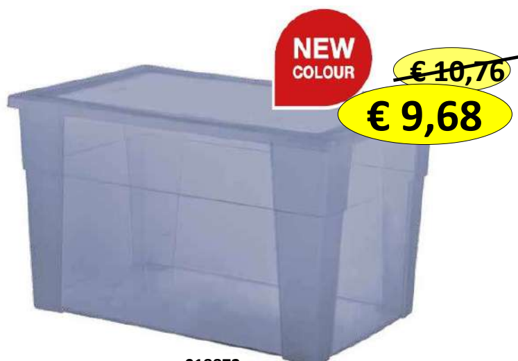
018872 SCATOLA VISUALBOX 60X40X35 LT.62 BLU NAVY