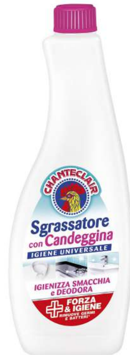
242113 CANDEGGINA CHANTE CLAIR SGRASSATORE RICARICA ML.625