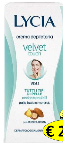
114207 CREMA VISO ML.50 PERFECT