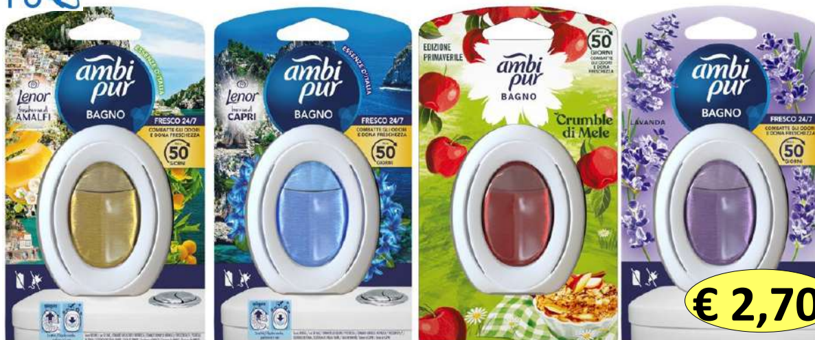
220513-220514-176169-220128 AMBIPUR DEODORANTI BAGNO 50 GIORNI