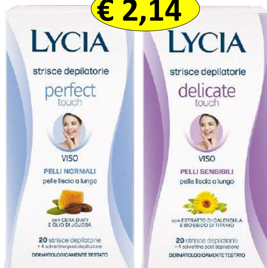
114206-114208 STRISCE VISO X20 PERFECT/DELICATE