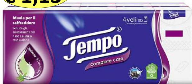
021310 FAZZOLETTI X 10 COMPLETE CARE