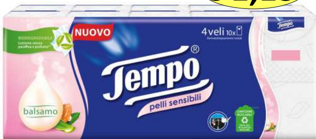
021350 FAZZOLETTI X 10 SENSIBILI