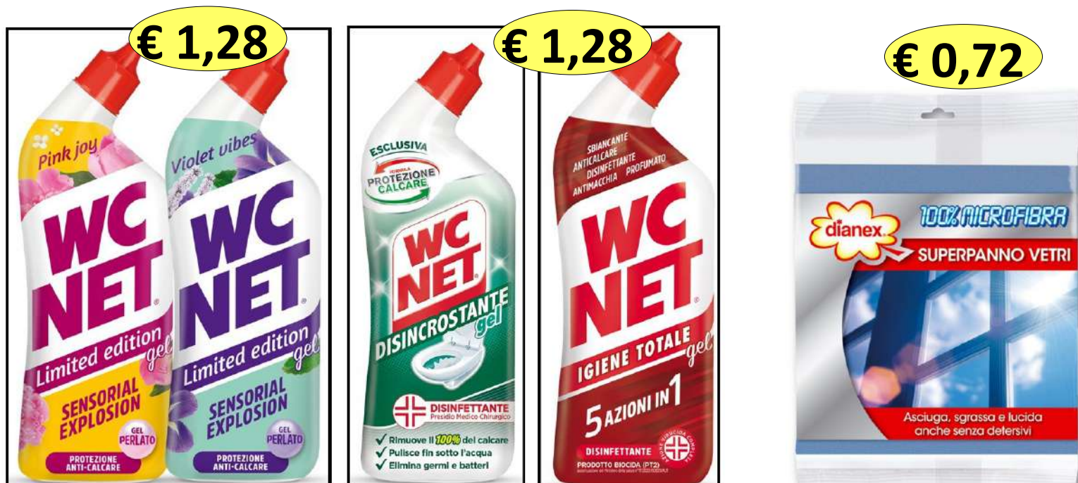
226312 PERLATO MIX - 226320 DISINCROSTANTE - 226324 TOTAL WC NET GEL ML.700