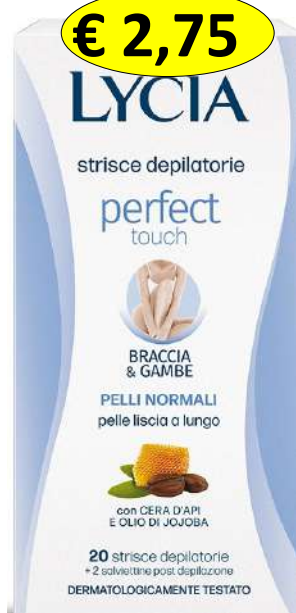
114205 STRISCE BRACCIA-GAMBE 20 PERFECT