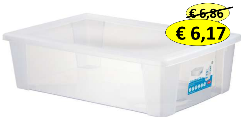
018864 SCATOLA VISUALBOX 59X39X17 LT.30