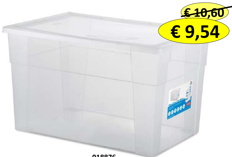
018876 SCATOLA VISUALBOX 60X40X35 LT.62