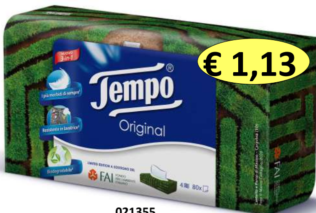
021355 FAZZOLETTI VELINE BOX X 80 4 VELI