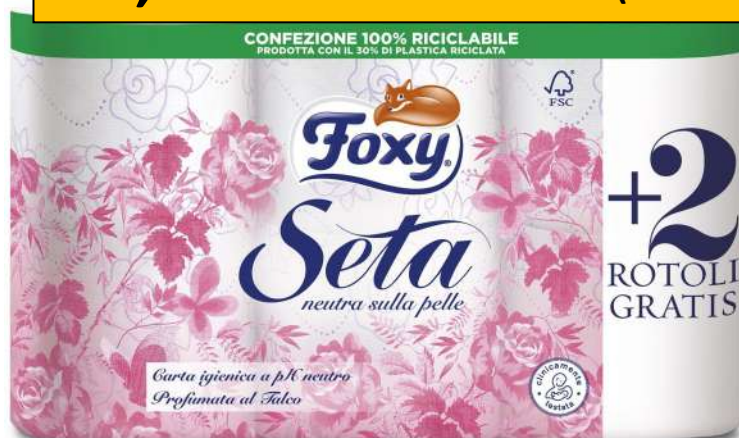
009150 FOXY SETA CARTA IGIENICA 4+2 OMAGGIO