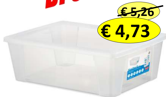
018863 SCATOLA VISUALBOX 40X30X17 LT.15