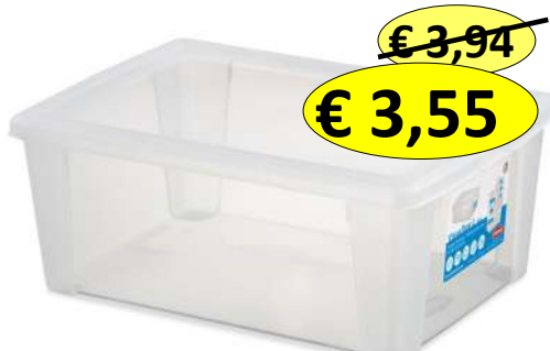
018862 SCATOLA VISUALBOX 36X25X14 LT.10