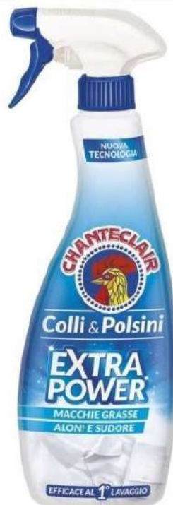
240113 CHANTE CLAIR SGRASSATORE COLLI POLSINI ML.500 VAPO