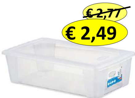
018861 SCATOLA VISUALBOX 32X19X11 LT.5