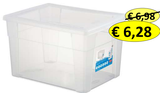
018873 SCATOLA VISUALBOX 40X30X24 LT.20